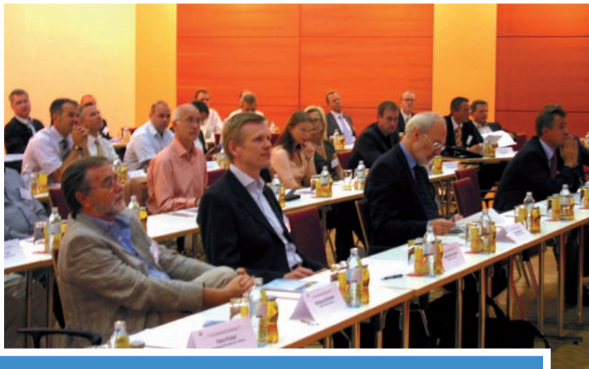
EWA-Kongress in Bad Schallerbach